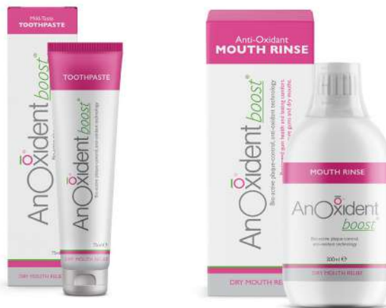
AnOxidant boost Pasta de Dentes 75ml