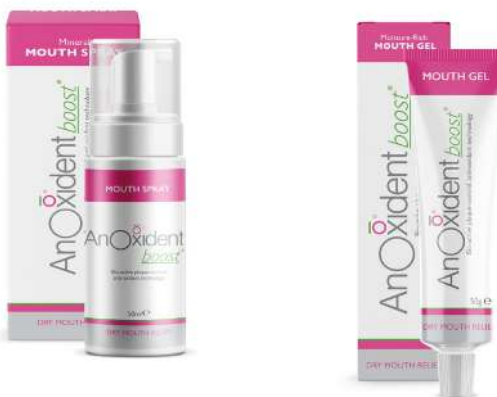
AnOxidant boost Spray Oral 50ml